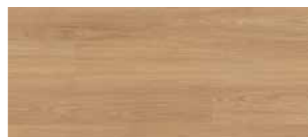
ORI00544 - ROVERE RACCONTO