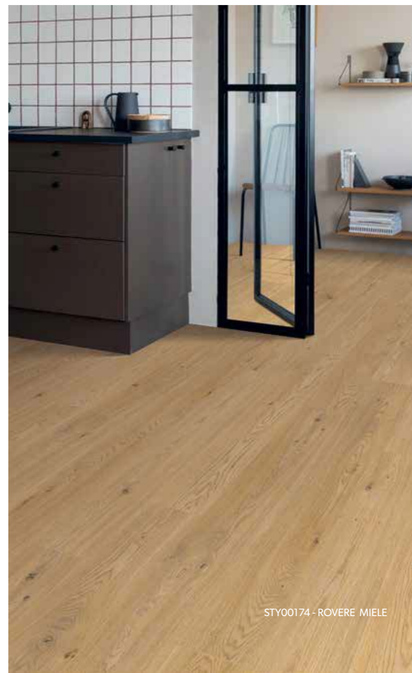
STY00174 - ROVERE MIELE