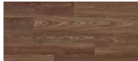
ORI00549 - ROVERE CIOCCOLATO