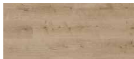
ORI00550 - ROVERE NOCCIOLA