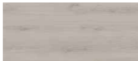
ORI00180 - ROVERE STERLING