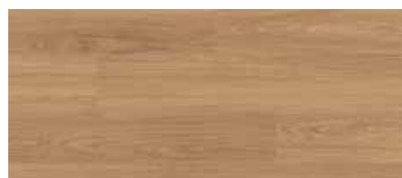
ORI00543 - ROVERE LEGGENDA