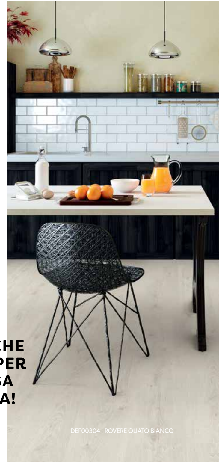
DEF00304 - ROVERE OLIATO BIANCO