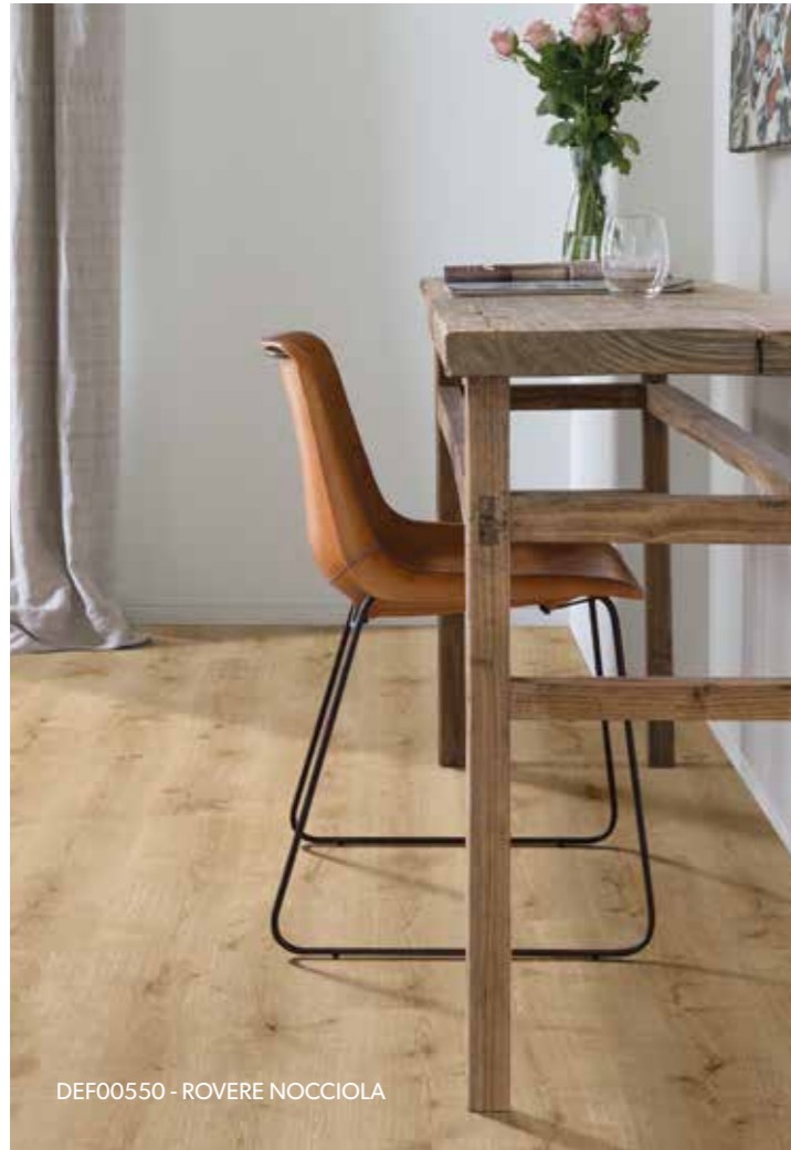
DEF00550 - ROVERE NOCCIOLA

La gamma Vitality ha tutto ciò che ti aspetti da un pavimento in laminato: decori iper realistici e un sistema a incastro che rende la posa veloce e duratura nel tempo. Perché un pavimento Vitality è un pavimento per tutta la vita.