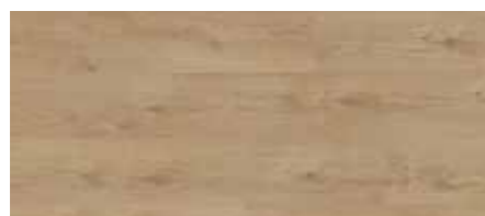
ORI00383 - ROVERE VERNICIATO NATURALE