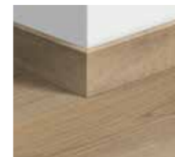
Standard: SFSK(-) 2400x58x12 mm

Finitura perfetta grazie al battiscopa abbinato al decorativo del tuo pavimento.