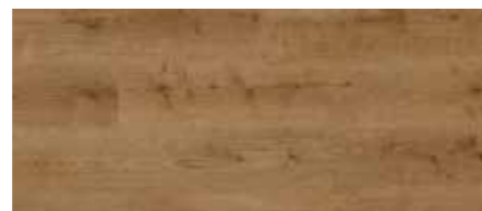
ORI00552 - ROVERE PECAN