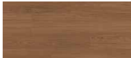
ORI00541 - ROVERE FIABA