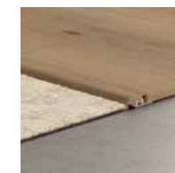
Profilo di transizione 2150 x 41 x 13 mm permette di connettere il tuo pavimento in laminato a un altro tipo di pavimentazione.