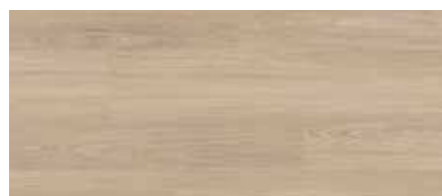
ORI00545 - ROVERE AVORIO