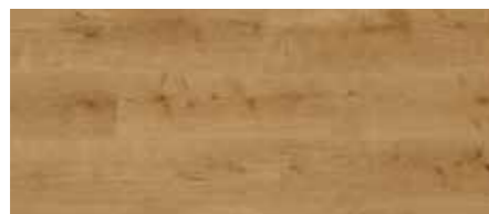
ORI00551 - ROVERE CANNELLA