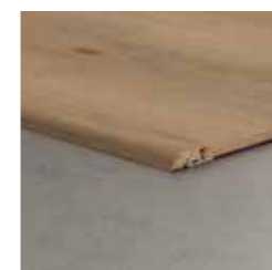
Profilo di adattamento 2150 x 48 x 13 mm connette due pavimenti di altezza differente