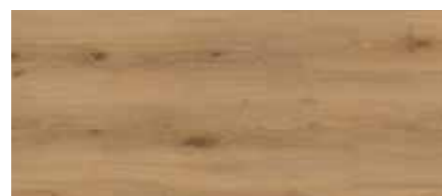
ORI00409 - ROVERE BIONDO