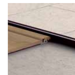
Profilo terminale 2150 x 41 x 13 mm termina il tuo pavimento lungo pareti o finestre