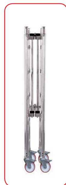
La base del Modulo A di Roller Plus è richiudibile (m 1,70) e passa attraverso porte standard