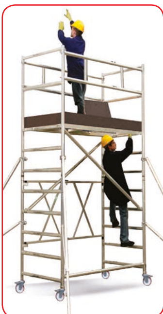
Roller Plus L m 3,46 (Moduli A+B5+S)