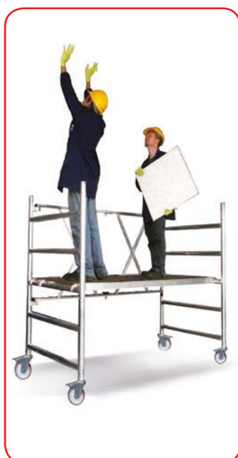
Roller Plus L m 1,70 Modulo A